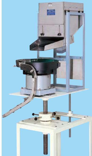
キャップ供給機もあります。 Cap feeder is also available.