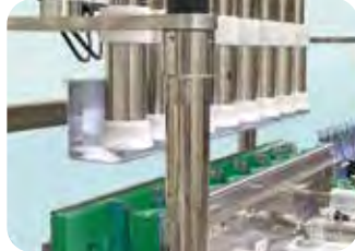
「液垂れ防止ユニット」